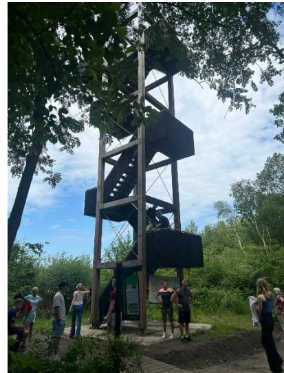
GKV bezoekers bij de uitkijktoren in IJhorst