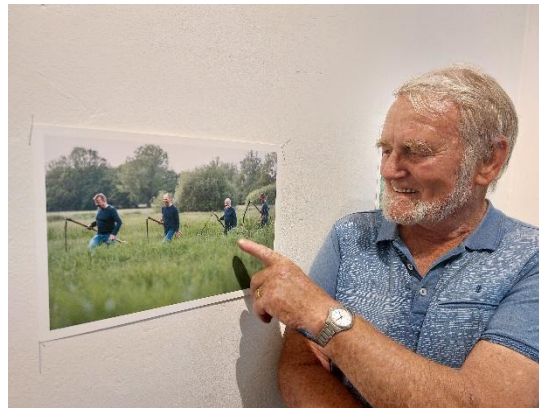
dubbelportret van Zendemaaiër (Gemaaid)