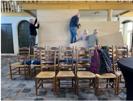
Tentoonstelling in de kerk in opbouw