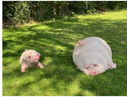
When the flood comes, Margriet van Breevoort