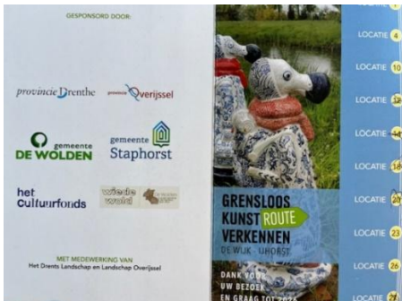
laatste pagina plus achterflap catalogus 2024

Enkele ondernemers uit de dorpen hebben ons ondersteund met sponsoring in natura.