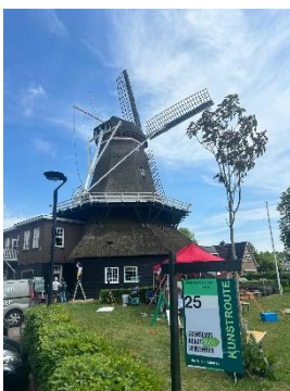
Locatie 25 bij de molen