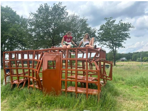
Klimplezier op de Cage