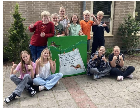
Basisschool IJhorst blij met MIAM