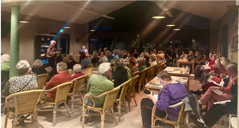
Informatie- en voorbereidingsavond voor betrokken vrijwilligers over GKV 2024, 17 april 2024

Naar aanleiding van GKV 2024 hebben zich ongeveer twintig nieuwe suppoosten aangemeld. In totaal besteden de vrijwilligers ongeveer 4000 uren, zonder dat hier een geldelijke vergoeding tegenover staat. Het bestuur dankt iedereen voor de enorme inzet en betrokkenheid bij de organisatie van Grensloos Kunst Verkennen 2024.