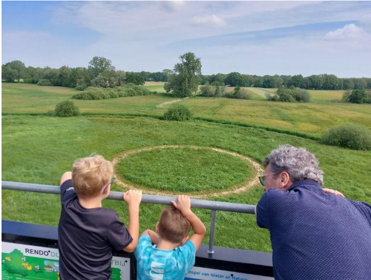
'Gemaaid' van Merijn Vrij vanaf de uitkijktoren in IJhorst