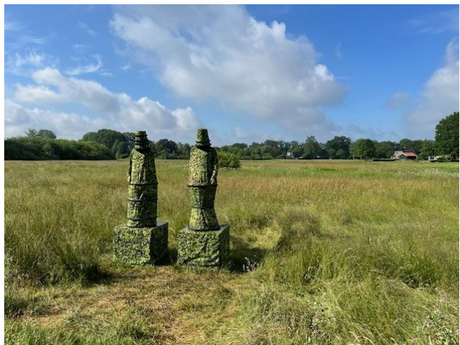
Wachters, Guda Koster, GKV 2024