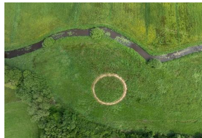
Gemaaid, Merijn Vrij, GKV 2024