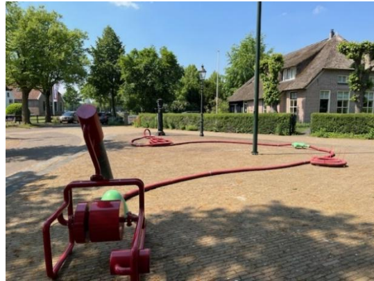
Extractoscoop op het Kerkplein in IJhorst, Willem Harbers, GKV 2024

Naast sculpturen, tekeningen, schilderijen, kunst in het landschap, werk van textiel en van glas, keramiek en video, waren er diverse installaties verbonden met en geïnspireerd door het Reestdal landschap. Een van onze jonge kunstenaars bouwde twee installaties die door het stromende water in de loop van de tijd transformeerden.