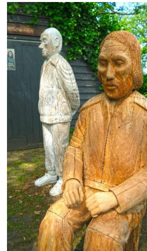
'Bij de stillen' van Ingrid Mol