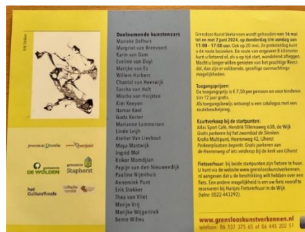
achterkant flyer GKV 2024